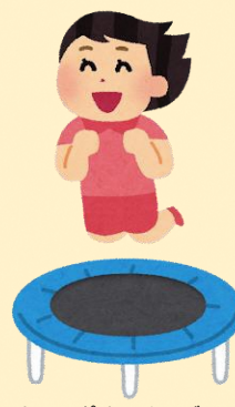
トランポリン・キッズコーナー