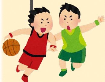
バスケットボール(ゲーム・フリースロー)