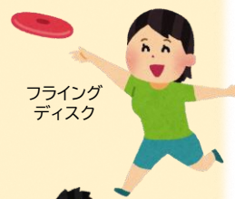
フライング ディスク