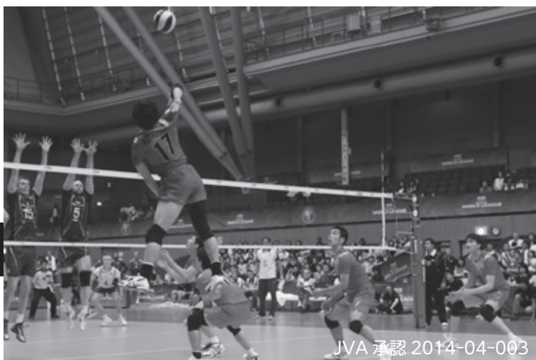
JVA 承認 2014-04-003