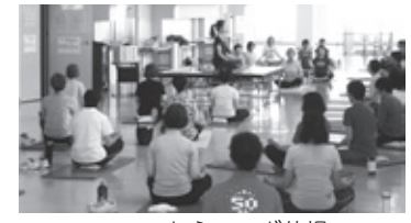
フィットネスヨガ体操