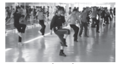
シェイプアップエアロ