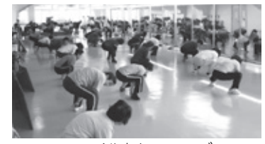
スマイルトレーニング