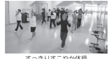
すっきりすこやか体操