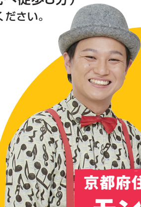
京都府住みます芸人 モンブラン

(株)よしもとクリエイティブ・エージェンシー所属の京都府住みます芸人。得意の大道芸で、ご来場のみなさんを盛り上げます。